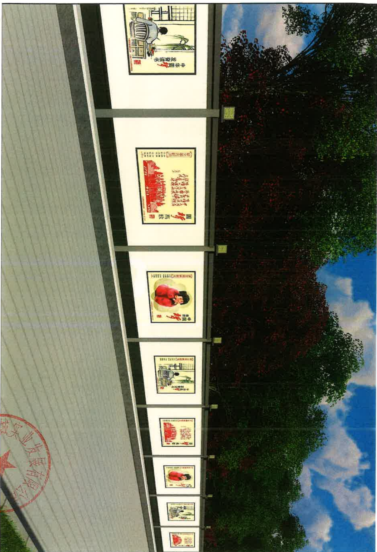
装配式钢结构围挡效果图