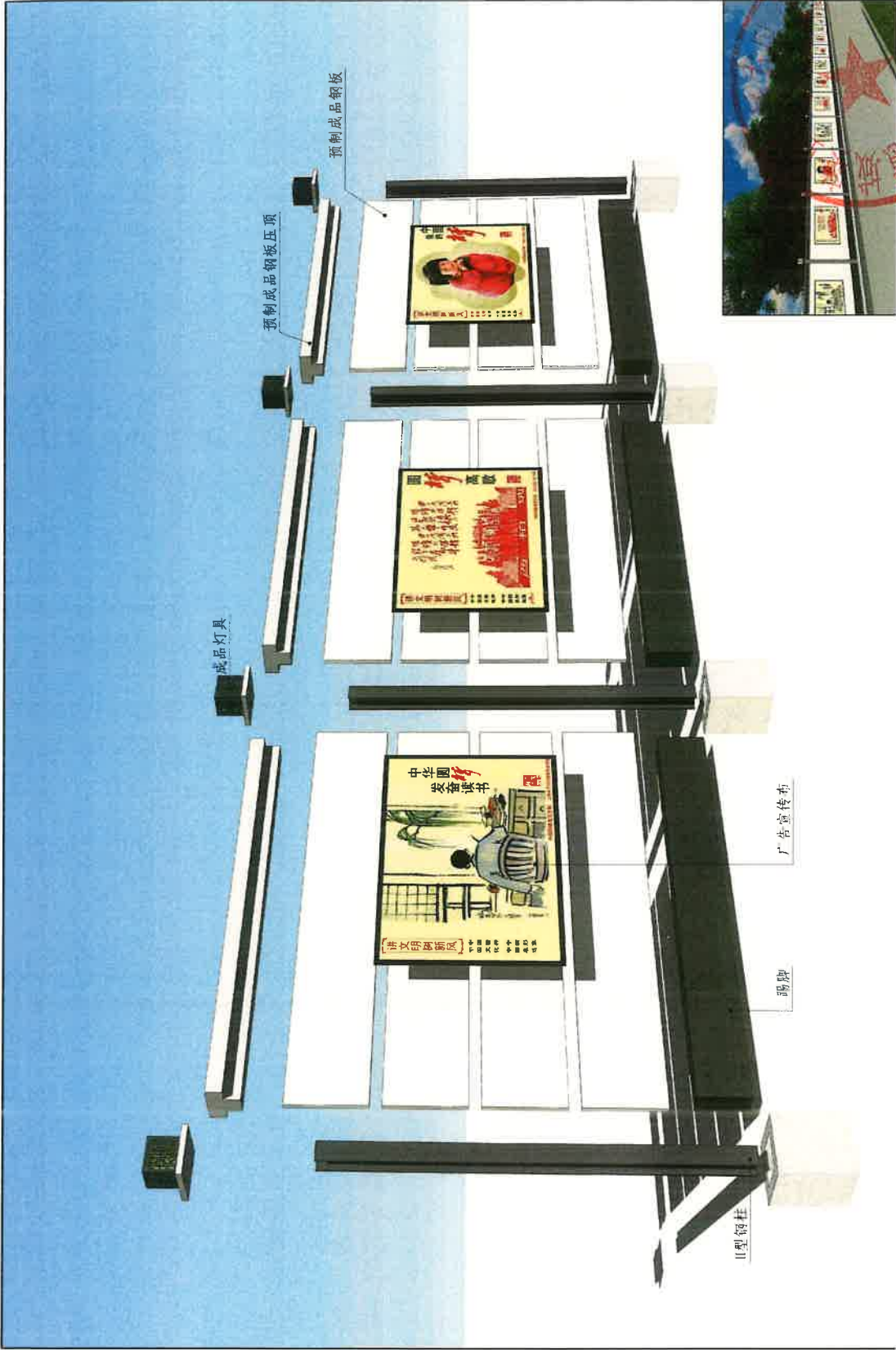
装配式钢结构围挡拆分图